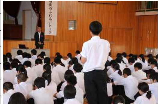
【市長とのふれあいトーク】