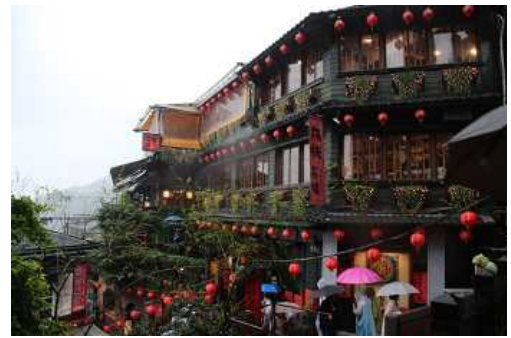
【29年度修学旅行～台湾～】 ※ 30年度は台湾、31年度はシンガポールです