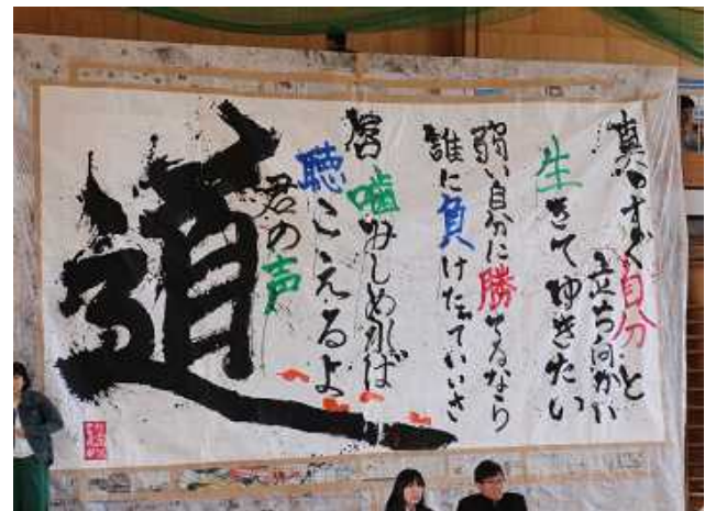
【書道部：書道パフォーマンス】