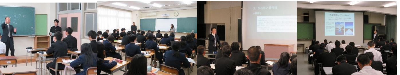
地域教育文化学部（論語に学ぶ）、人文学部（音声学）