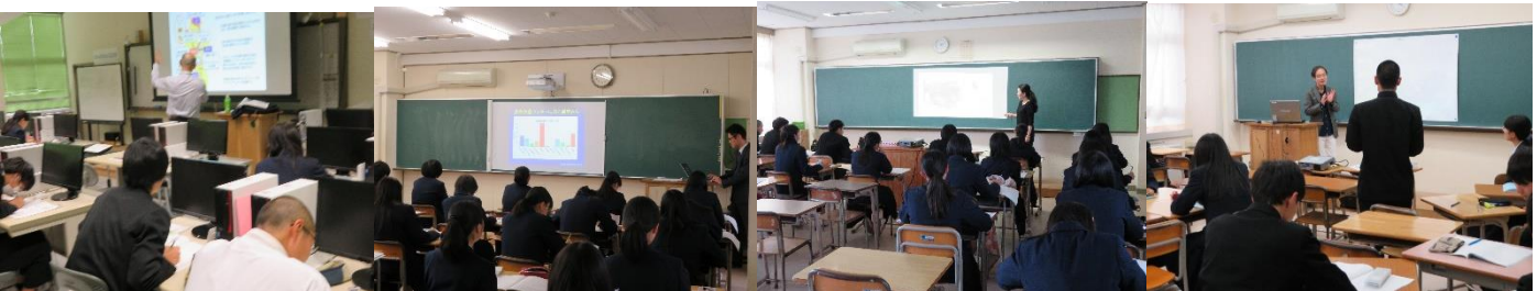
人間生活学部（栄養）