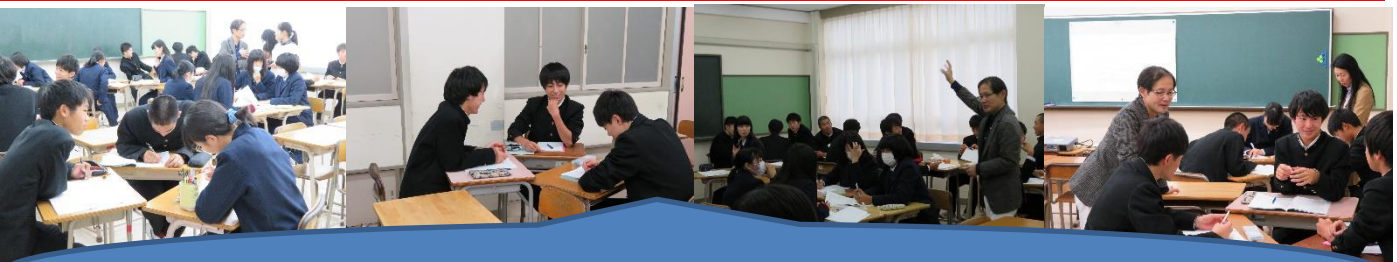
教育学部（地域活性化）